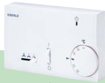
KLR-E 525 52 hp