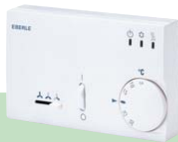
KLR-E 525 52 4p